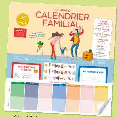
Grand Calendrier familial 2020-2021